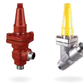
SVL Flexline™ – Rohrleitungskomponenten

Alle Flexline Produkte basieren auf einem modularen Gesamtkonzept und zeichnen sich durch die Verwendung des gleichen Grundgehäuses für verschiedene Anwendungen aus. Dieses Baukastenprinzip bedeutet für den Kunden kürzeste Lieferzeiten aufgrund reduzierter Komplexität und voller Flexibilität bei Montage, Inbetriebnahme und Wartung. Durch Flexline können die Gesamtzykluskosten einer Großkälteanlage in erheblichem Maße reduziert und deutliche Einsparungen erzielt werden.