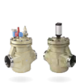
ICV Flexline™ – Haupt- und Motorventile

Das Flexline™ Konzept bietet sinnvolle Vereinfachung, zeitsparende Effizienz sowie maximale Flexibilität für Industriekälteanlagen und umfasst drei Produktkategorien: