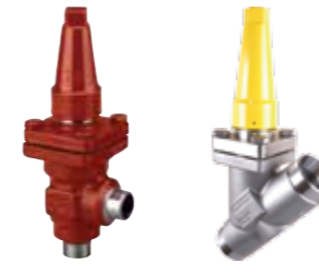
SVL Flexline™ – Componentes de línea

Todos los productos se basan en un diseño modular; el cuerpo no incorpora ninguna función. Este tipo de configuración minimiza la complejidad durante las etapas de diseño, instalación, puesta en servicio y mantenimiento. Todo ello está destinado a reducir los costes totales asociados al ciclo de vida y proporcionar el máximo ahorro.