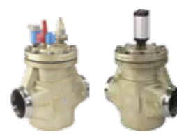
ICV Flexline™ – Válvulas de control

Diseñada para proporcionar sencillez inteligente, la máxima eficiencia y una avanzada flexibilidad, la serie Flexline™ se compone de tres populares categorías: