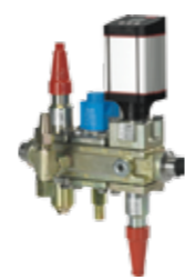
ICF Flexline™ – Estaciones de válvulas completas