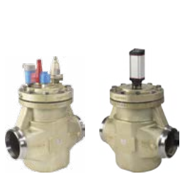
ICV Flexline™ – Haupt- und Motorventile

Das Flexline™ Konzept bietet sinnvolle Vereinfachung, zeitsparende Effizienz sowie maximale Flexibilität für Industriekälteanlagen und umfasst drei Produktkategorien: