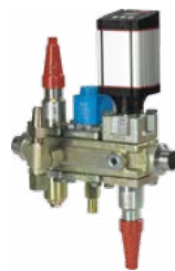
ICF Flexline™ – Kompakte Ventilstationen