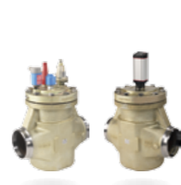
ICV Flexline™ —工业控制阀