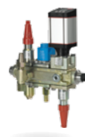
ICF Flexline™ —工业组合阀