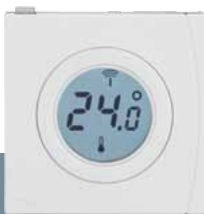
Sensor de temperatura ambiente Danfoss Link™ RS

Las mallas calefactoras eléctricas de suelo radiante se utilizan con frecuencia como sistema de calefacción complementario de los radiadores o bien como única fuente de calor. El sistema es rápido y garantiza temperaturas ambiente agradables en cualquier momento del día.