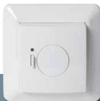
Termostato de suelo Danfoss Link™ FT