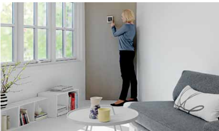
Controlador central para viviendas familiares completas, pequeños edificios de apartamentos, bloques de viviendas y pequeños edificios comerciales.