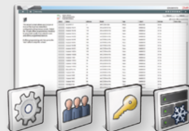
Inställningar Användare Licensiering Layout

De utsedda webbguiderna är avsedda att hjälpa användaren steg för steg med en stilren skärmformatering och dra och släpp-funktioner. Slutresultatet är förbättrade driftsättningstider och mindre risk för konfigurationsfel.