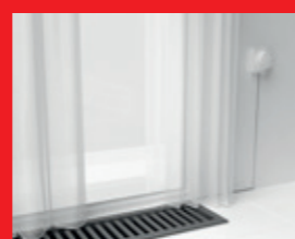
Voeler en bediening op afstand