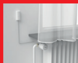
Voeler op afstand